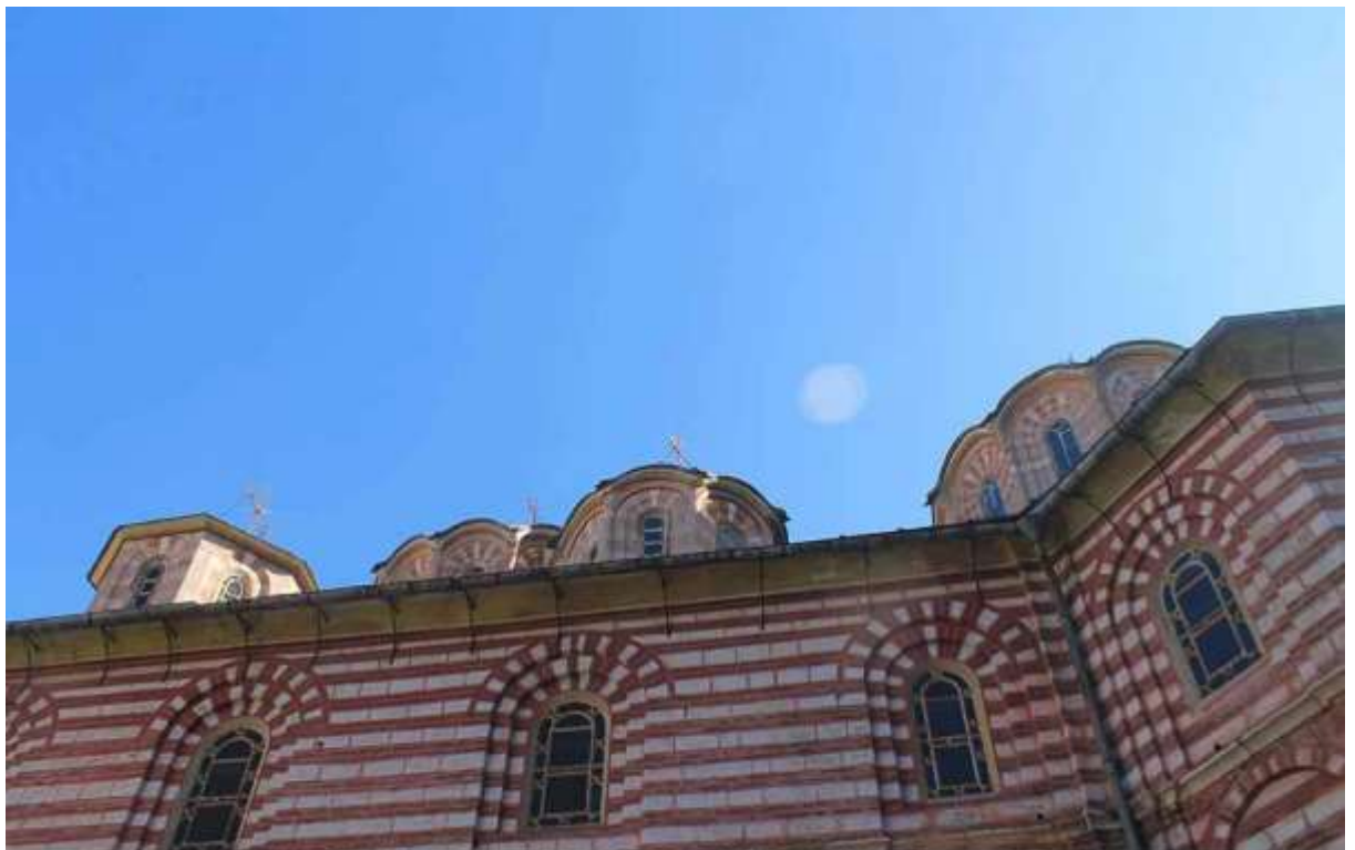
МАНАСТИР СВЕТИ ГЕОРГИ ЗОГРАФ -