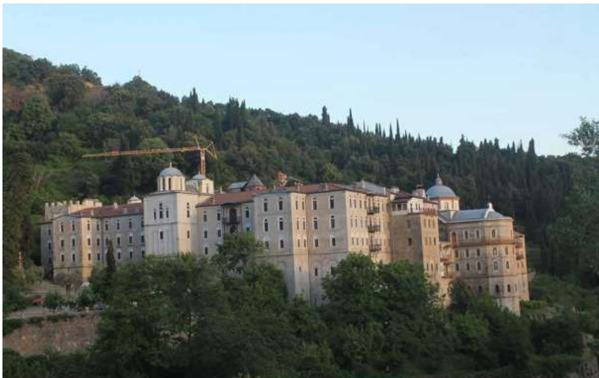
МОНАСТИР СВЕТИ ГЕОРГИ ЗОГРАФ